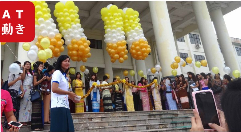
ヤンゴン経済大学 就職フェア開会式 の様子