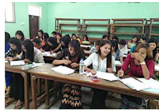
メイティエーラ経済大学の学生たち

しかし、マンダレーのみを勤務希望地とする仮登録者が1割程おり、中には自分の出身地であるマンダレーに根を下してキャリアを積み、管理職レベルを目指したいと意欲を持つ学生も見られた。J-SATは地域問わず、熱意ある学生の就職支援を継続して行っていく。